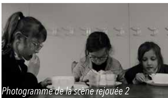
Photogramme de la scène rejouée 2