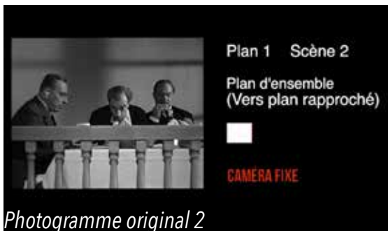
Photogramme original 2