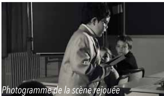
Photogramme de la scène rejouée